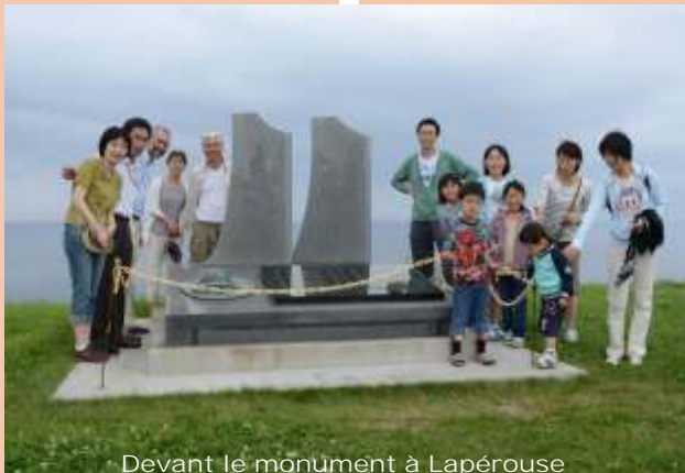
Devant le monument à Lapérouse